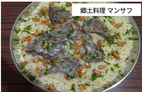
郷土料理 マンサフ